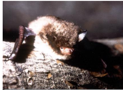
Murin de Daubenton