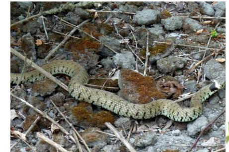
Couleuvre à collier