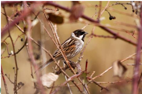
Bruant des roseaux