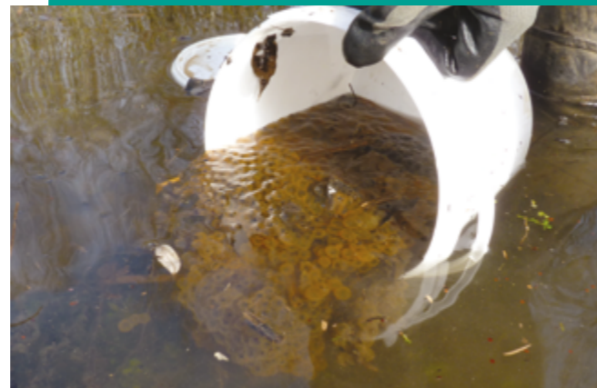
2 Elles sont ensuite remises à l'eau.