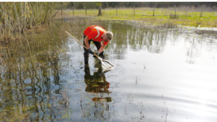
1 Les grenouilles et leurs pontes sont récupérées avec une épuisette.

Dans le cadre de ses engagements, l'EPTB Seine Grands Lacs adapte continuellement ses méthodes de travaux pour éviter toute gêne aux espèces locales. C'est ainsi que dans le cadre des opérations d'éradication de la renouée du Japon, nos équipes ont récupéré par épuisette dans la noue d'Auvergne, puis déplacé, dans une mare à proximité, des grenouilles et leurs pontes pour ne pas qu'elles soient affectées par les travaux. Une action non-prévue pour cette étape du chantier, mais la préservation de la biodiversité locale est une priorité!